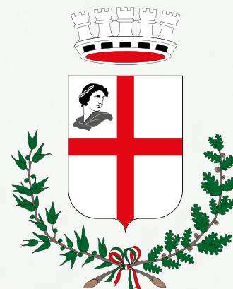
COMUNE DI MANTOVA