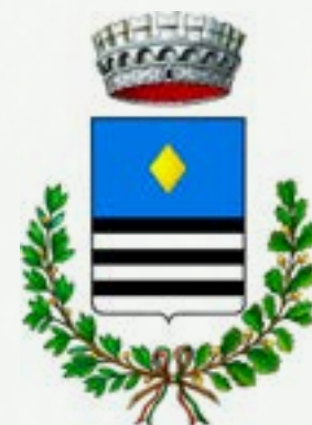
Comune di Isola Dovarese