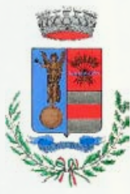
Comune di Calvatone