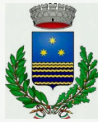
Comune di Acquanegra