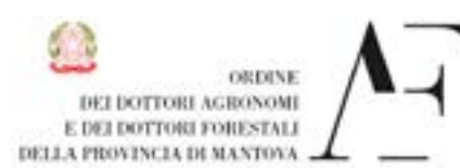
Ministero della Giustizia

La partecipazione all'evento consente il riconoscimento di n.2 CEU per le certificazioni European Tree Worker ed European Tree Technician