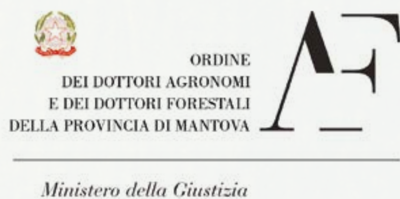
Ministero della Giustizia