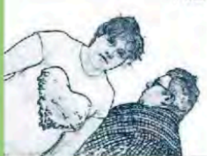
c.d.d Tam Tam | coop. Dolce IV D Martiri Belfiore