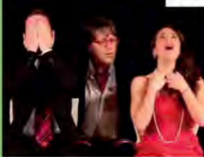
La Creta | Milano