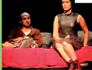
Movimento Comico | Roma