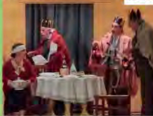
Il Socco e la Maschera | Milano