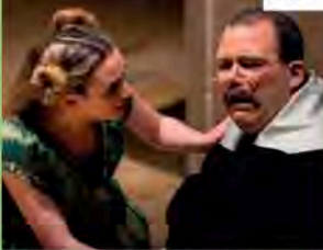
Compagnia Dell'Orso | Vicenza