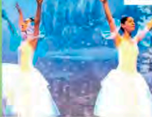
Step by Step | San Benedetto Po