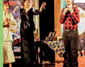
Il palcaccio | Mantova