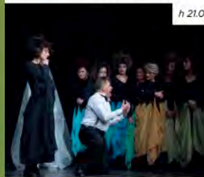
Quarta parete / Piacenza