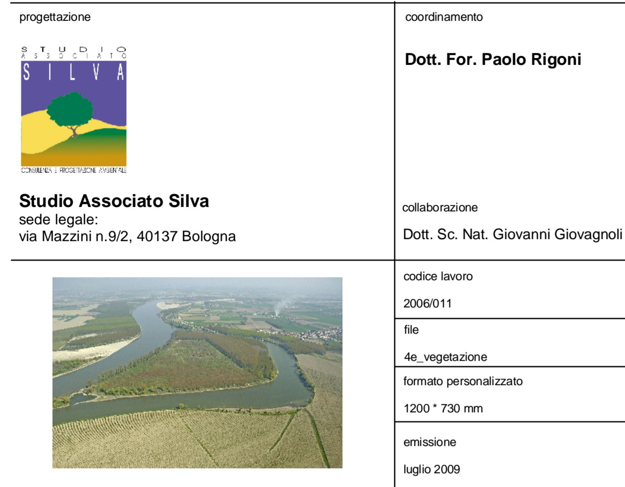
Tav. 4e - Carta della vegetazione